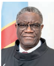
Dr. Denis Mukwege, Panzi-Hospital Bukavu: Traumatisierte Opfer und straffreie Täter – der Skandal im Ostkongo